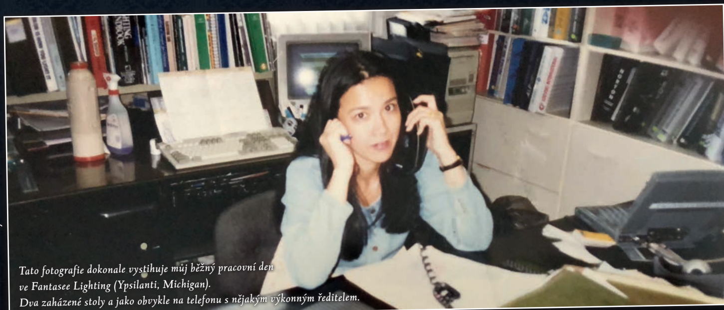
Tato fotografie dokonale vystihuje můj běžný pracovní den ve Fantasee Lighting (Ypsilanti, Michigan). Dva zaházené stoly a jako obvykle na telefonu s nějakým výkonným ředitelem.

Většina zásadních společností pro osvětlování v USA se snažila ukrást naše klienty. Byla jsem velmi ochranná, abych dokázala