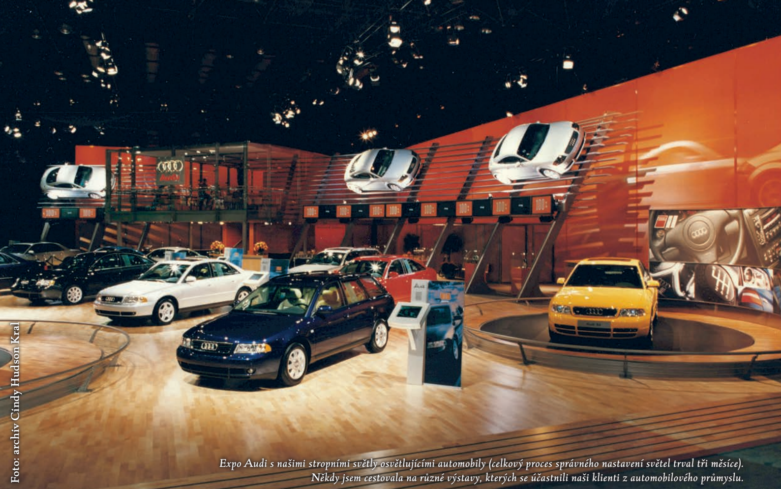
Expo Audi s našimi stropními světly osvětlujícími automobily (celkový proces správného nastavení světel trval tři měsíce). Někdy jsem cestovala na různé výstavy, kterých se účastnili naši klienti z automobilového průmyslu.

manžel a rodina z Velké Británie. Vždy si společně užívali spousty jídla, alkoholu a dlouhých konverzací. Naše spolupráce dopadla skvěle.