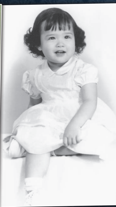
Já jako neposedné dítě v Ann Arbor v Michiganu, snažící se nehybně sedět kvůli fotografovi.